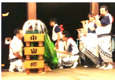
小山郷・六斎念仏 上御霊神社にて8月18日