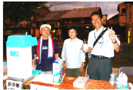
西陣大好き盆踊り 27日 雨の中ご苦労様でした