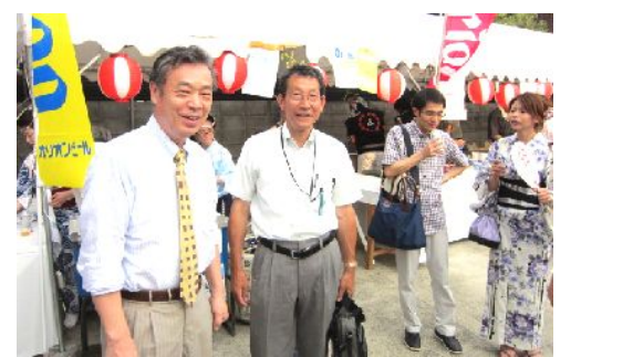
上七軒のお祭りに こくた衆院議員と参加 7.29

国民世論は消費税増税反対が多数です。増税実施までには衆院選、参院選が確実に行なわれます。増税勢力に審判を与え、実施を阻止させましょう！