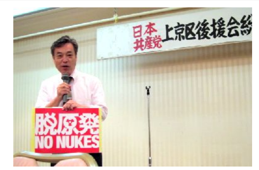
上京後援会総会で挨拶する こくた衆院議員と倉林明子 参院予定候補